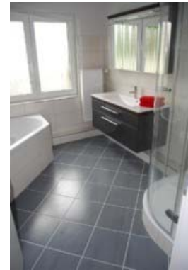
Ein luxuriöses Bad